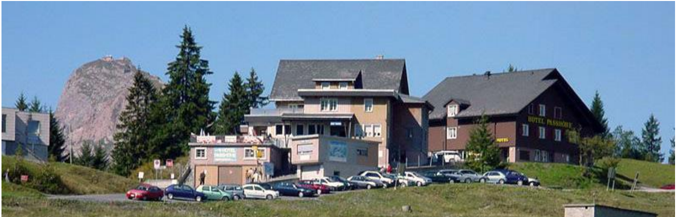
Startort Ibergeregg - von weitem grüsst der Grosse Mythen (links hinten)

Anmeldeschluss: 14. Juni Zu dieser Wanderung sind alle, auch Nichtmitglieder, eingeladen. Kosten (f.d. Transport mit Kleinbus) Fr. 20.- /Erwachsene, 10.-/Schulpflichtige Alle Angemeldeten erhalten Detail-Infos (z.B. mit Zeiten ...) Auskunft/Anmeldung: Peter Künzle 071 931 34 42 peterkuenzle@gmx.ch