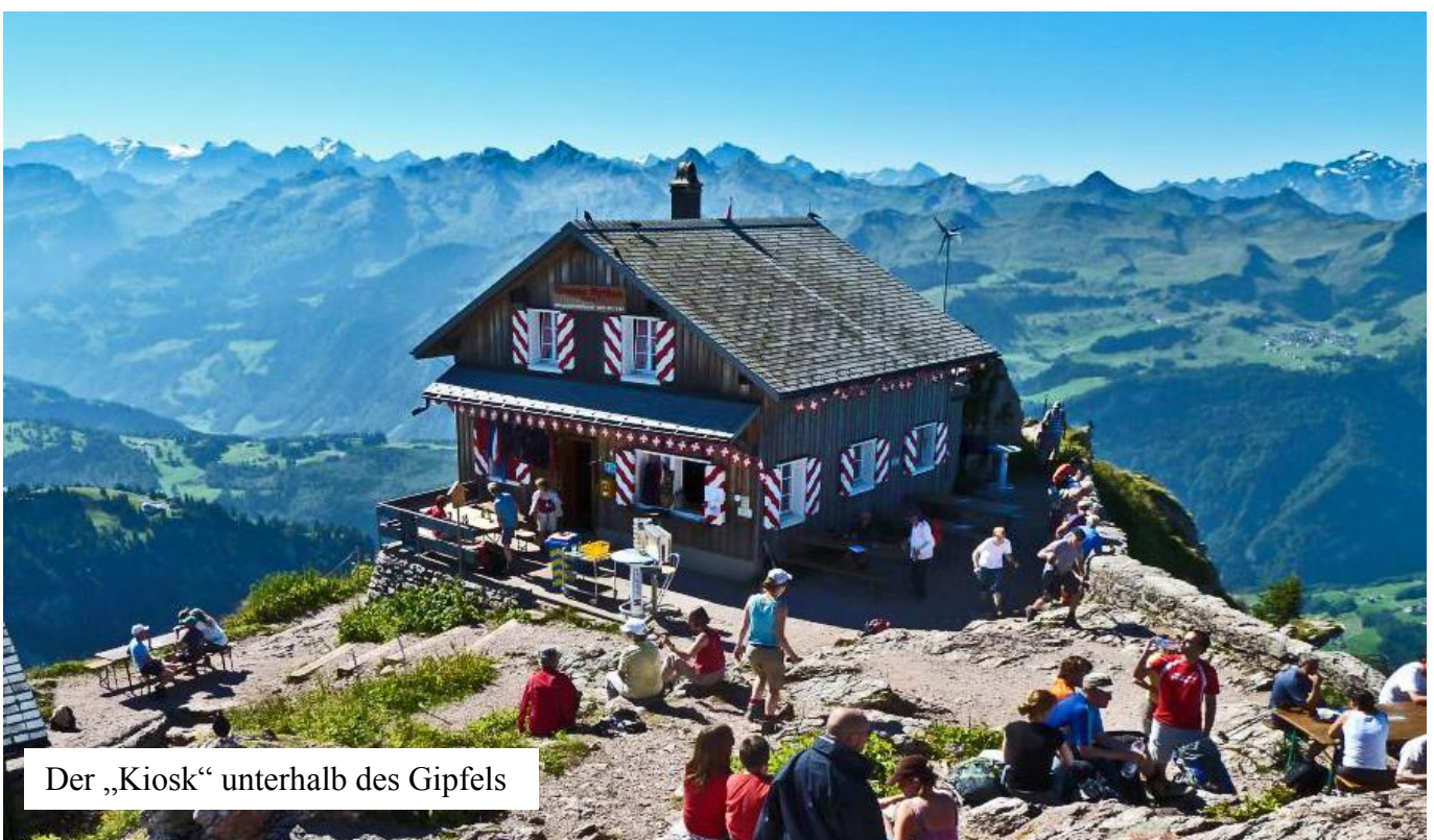
Der „Kiosk“ unterhalb des Gipfels