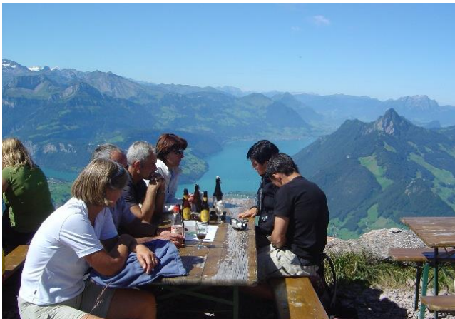
Aussicht auf dem Grossen Mythen