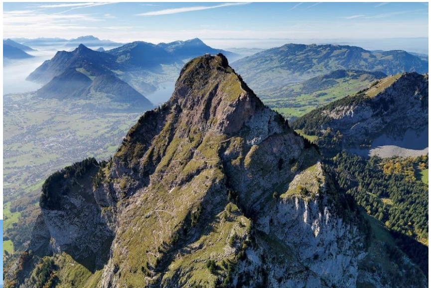
der Grosse Mythen – die Aussichtspyramide