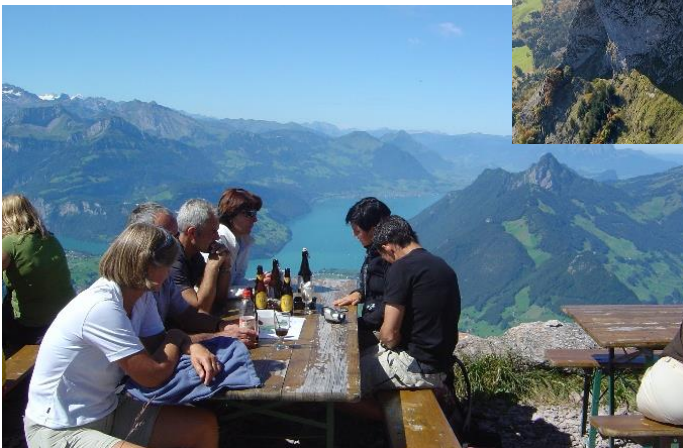
Aussicht auf dem Grossen Mythen Kiosk auf dem Gipfel