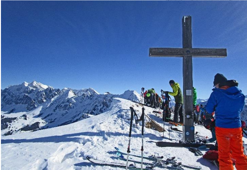
auf dem Stockberg Blick zum Säntis